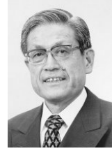
江戸東京博物館 館長 竹内 誠