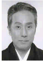
歌舞伎俳優 中村勲三郎